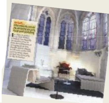
Après les USA, Nantes : lieux de cultes et églises sont transformés en appartements, commerces, salle de restaurants et même night club.