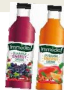
100% jus de fruit IMMEDIA flirte avec la sémantique des Energy Drinks..

➔ L'explosion créative 2009/2010, à la convergence des Tendances et Contre-tendances, ouvre la porte à d'autres insights et voies de réflexion.