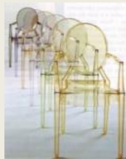
New design pour « old »Mini, la Rétro-Modernité est une des clés du succès.

L'INNOVATION, a contrario, nous projette dans un FUTUR, mais le futur fait peur.. >> MARIONS LES, en partant de l'ADN de nos marques pour faire la différence !